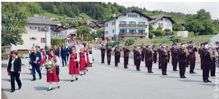
Procession de la Fête-Dieu à Chermignon-d'en Haut.