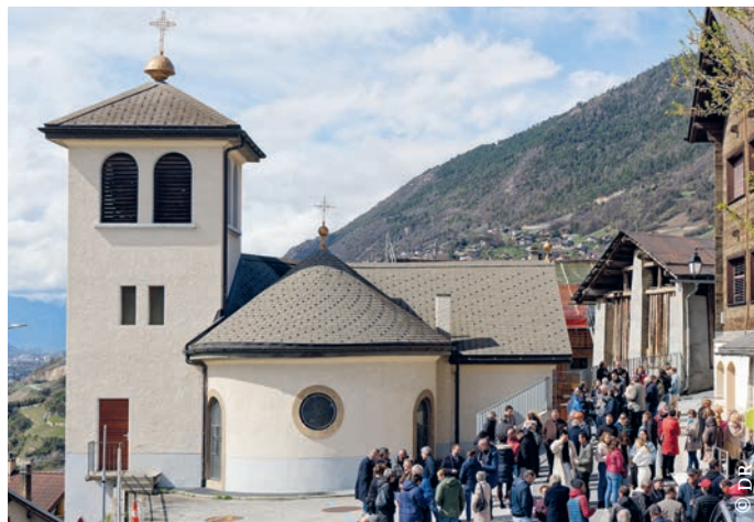
Inauguration de la chapelle d'Ollon.