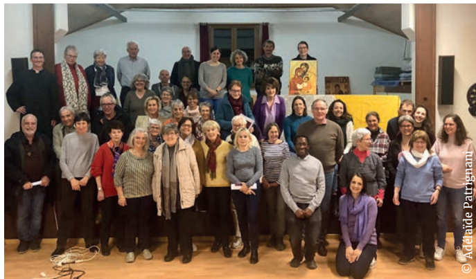
Le groupe du parcours gratitude.

Le parcours gratitude a été suivi par une cinquantaine de personnes pendant le temps du Carême, à la salle paroissiale de Lens, au cours de quatre soirées. Il s'est clôturé par une veillée de prière à l'église, samedi 23 mars, veille des Rameaux. « Le témoignage des animateurs et les échanges en groupe » ont été appréciés au cours des soirées, ainsi que « les chants de louange » et le fait « découvrir les bienfaits de la gratitude », comme l'ont souligné des participants. Merci à la communauté de l'Emmanuel pour l'animation de ce parcours.