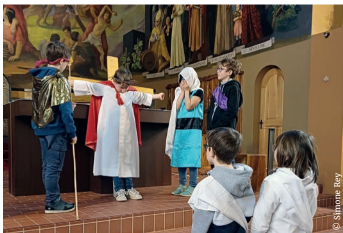
Une scène de la Passion du Christ.

Les enfants de 6H ont interprété avec talent la Passion du Christ lors de la fenêtre catéchétique du vendredi 9 mars à l'église de Montana Village.