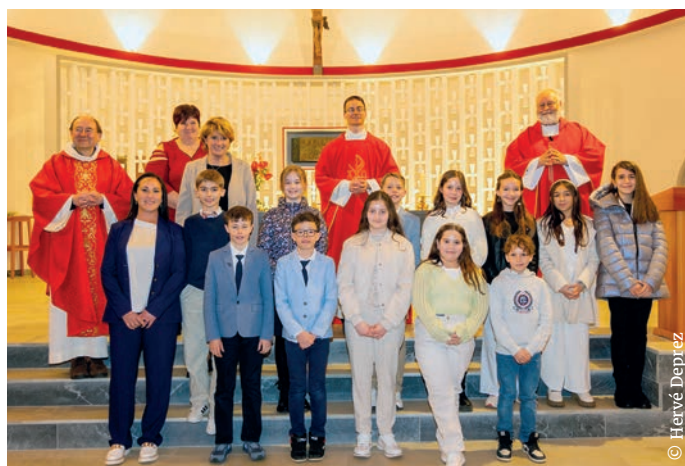
Les confirmés de Crans-Montana.

Une trentaine de jeunes et une adulte ont reçu le sacrement de la confirmation, le samedi 16 mars à Crans-Montana (photo), et le dimanche 17 mars à Lens, en présence du vicaire général du diocèse de Sion, Pierre-Yves Maillard.