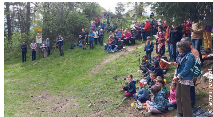
Messe au Christ-Roi, Ascension 2023.

A 9h15, pèlerins et fidèles partiront de l'église de Lens en direction de la colline du Christ-Roi où la messe sera célébrée à 10h00. La célébration sera suivie d'un apéritif. Prenez aussi votre pique-nique pour clore cette belle matinée.