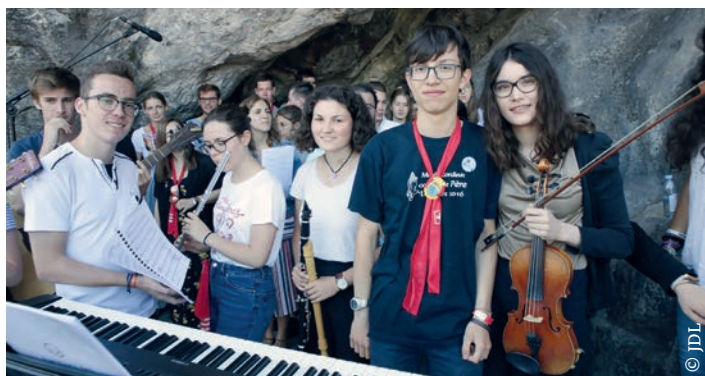
Les Jeunes de Lourdes au sanctuaire marial

L es Jeunes de Lourdes, c'est un groupe de jeunes entre 16 et 30 ans qui se retrouvent l'été à Lourdes pour vivre des moments d'entraide et de partage avec les personnes en situation de handicap.