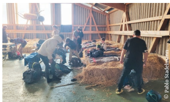
Nuit sur la paille pour un sommeil réparateur.