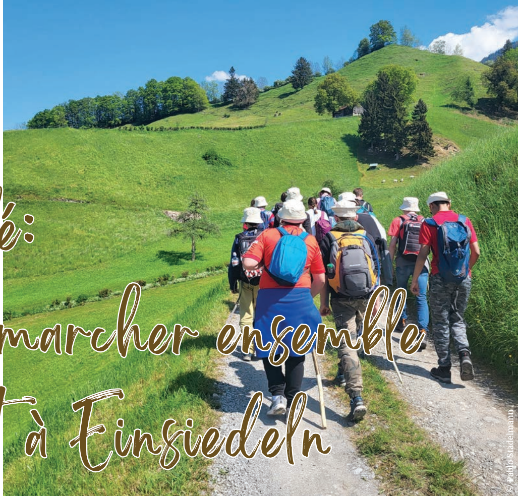
Le groupe avance... entre terre et ciel.