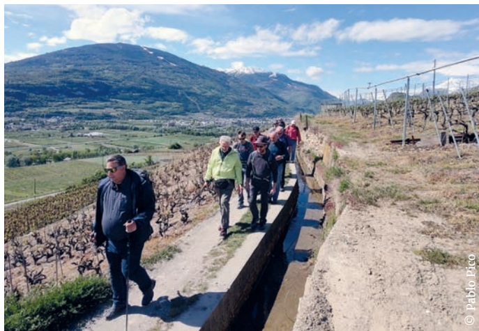
Les pères de familles en chemin vers le Christ-Roi.

Le 27 avril, le pèlerinage des pères de familles a rassemblé une douzaine d'hommes pour une journée de marche entre la basilique Notre-Dame de Valère et la colline du Christ-Roi. Des échanges fraternels et une messe « au sommet », au pied de la statue du Christ-Roi, pour couronner cette journée de ressourcement.