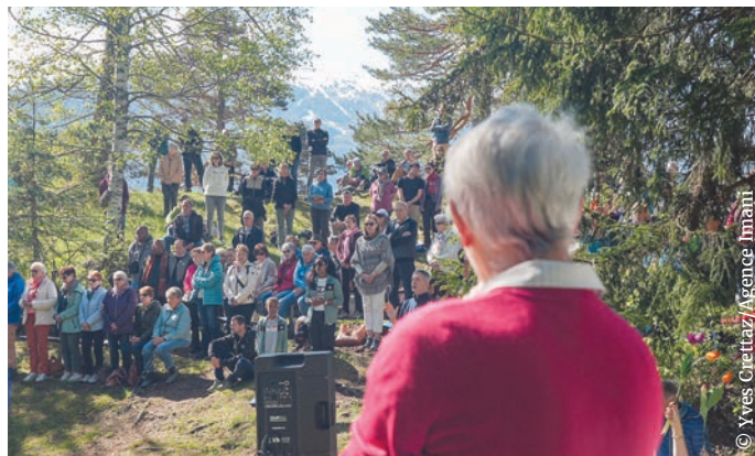
Messe de l'Ascension au Christ-Roi.