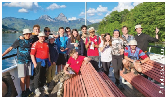
Une pause appréciée: la traversée du Lac des Quatre-Cantons en bateau.

Le groupe Fun and God accueille volontiers, pour l'année 2024/2025, les jeunes du cycle intéressés! Renseignements sur le site https://noble-louable.ch/enfants-jeunes/