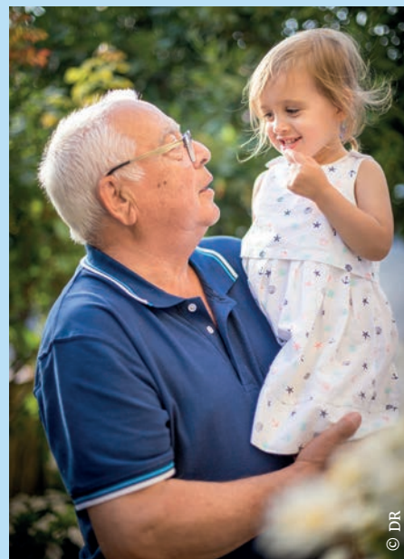
Instant de complicité entre générations.

Extrait du message du Pape François pour la 4 e Journée mondiale des grands-parents et des personnes âgées, qui sera célébrée le dimanche 28 juillet 2024.