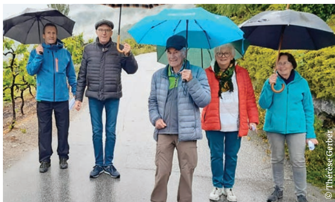
Pluie de bénédictions lors du pèlerinage des rogations.

Malgré la pluie, ils ont sillonné vignobles et sentiers... Les rogations, célébrées le 7 mai dernier, ont été l'occasion de demander les bienfaits de Dieu pour la terre cultivée, les vignes et le bétail. Une messe a ensuite été célébrée en la chapelle d'Ollon.