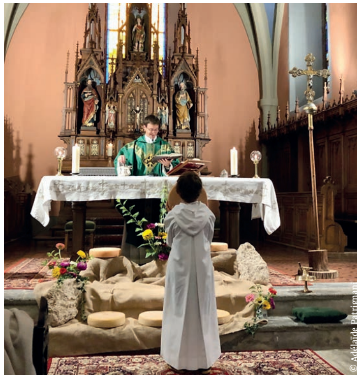
Messe des prémices en août 2023 à Saint-Maurice de Laques