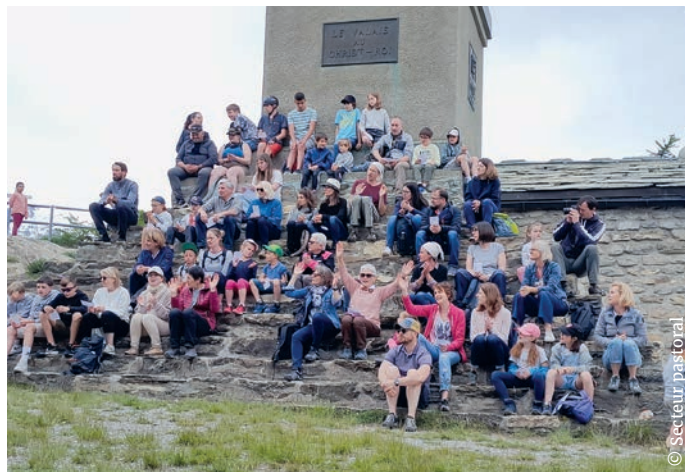
Dimanche Autrement à Lens.

Le « Dimanche autrement », ou une proposition ouverte à tous pour prier et partager, s'est déroulé le 26 mai à Lens. Cette formule innovante favorise une « Eglise aux portes ouvertes », plus accueillante et joyeuse. L'expérience pourrait se renouveler!